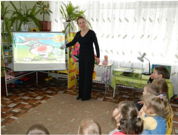
Д/г «Веселка щастя»